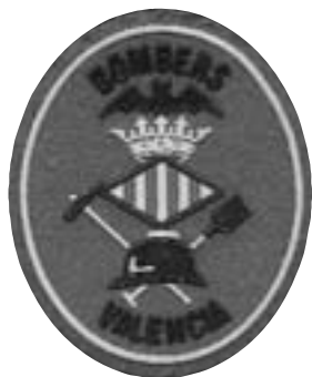
BOMBERS DE VALÈNCIA